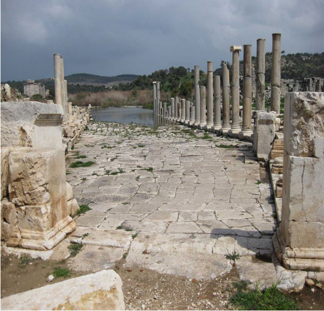
Patara Antik Kenti Antalya / Kaş